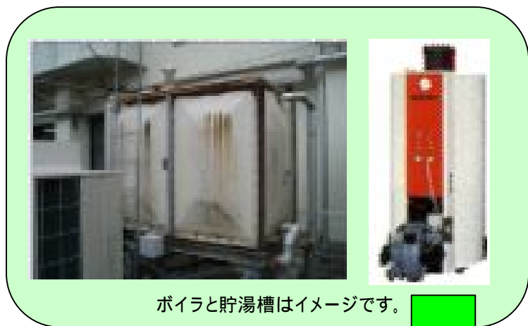
ボイラと貯湯槽はイメージです。